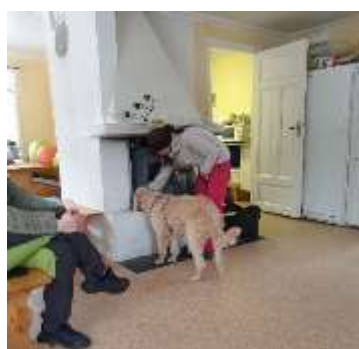
Prova på dag Nose Work

Klubben har under vårvintern haft 2 för klubben nya arrangemang