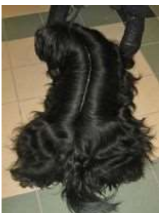
Utställning innebär mittbena.