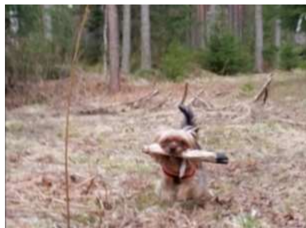
SEVCH SE UCH Keonomis upside down "Dipsy"

Intresset för Boston terrier väcktes och Evelinas köpte sin första Boston terrier Bringemors My Sweet Roses n bees "Kiwi" s 2021. Den första Boston kullen på 6 valpar har precis flyttat.