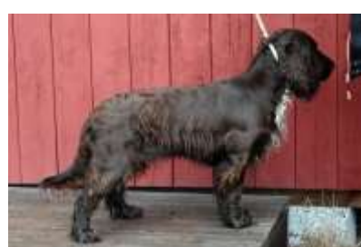
Utställningskurs för nybörjare